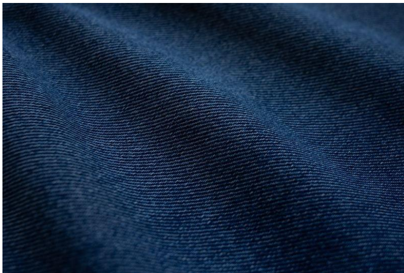
圖 2 Spinnova 牛仔布料