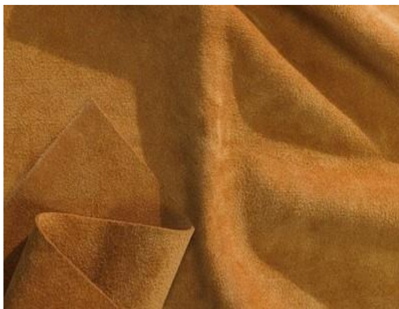
圖 1 Bio-Vera 人造皮革

Bio-Vera 可廣泛應用於各種產業，包括但不限於鞋類、室內設計、運輸及牆面護層。